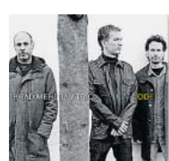
Brad Mehldau Trio, Ode.