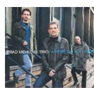
Brad Mehldau Trio, Where Do You Start.