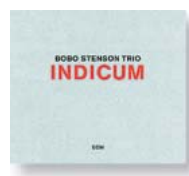
Bobo Stenson Trio, Indicum.